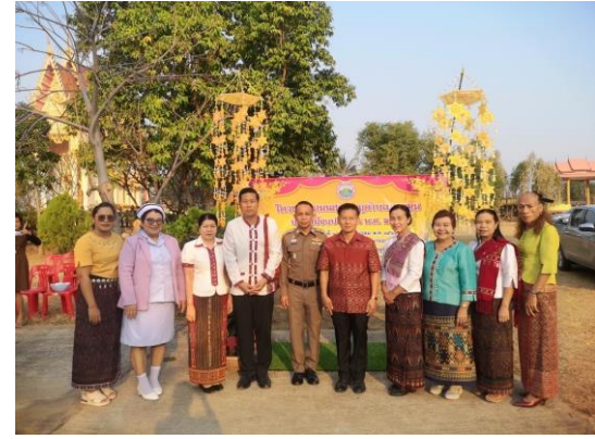
กิจกรรมเชิดชูคนดีข้าราชการพลเรือนดีเด่น/พยาบาลดีเด่น