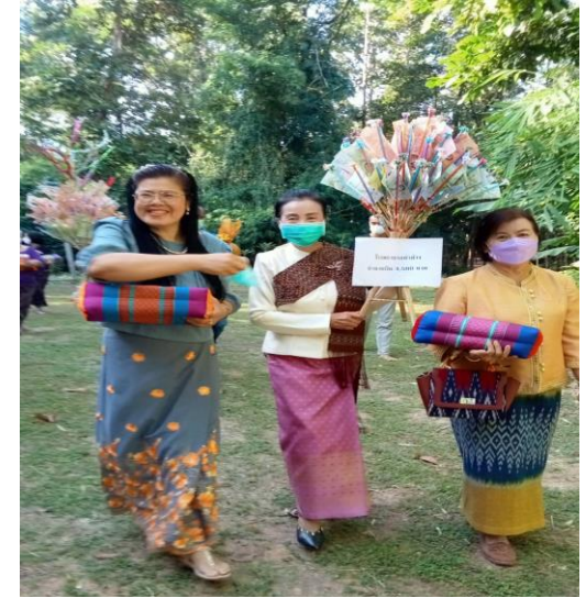
กฐินวัดป่าโสมพนัส อำเภอพรรณานิคม จังหวัดสกลนคร เมื่อ 6 พ.ย. 2565