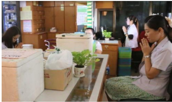
ระพุทธศาสนา